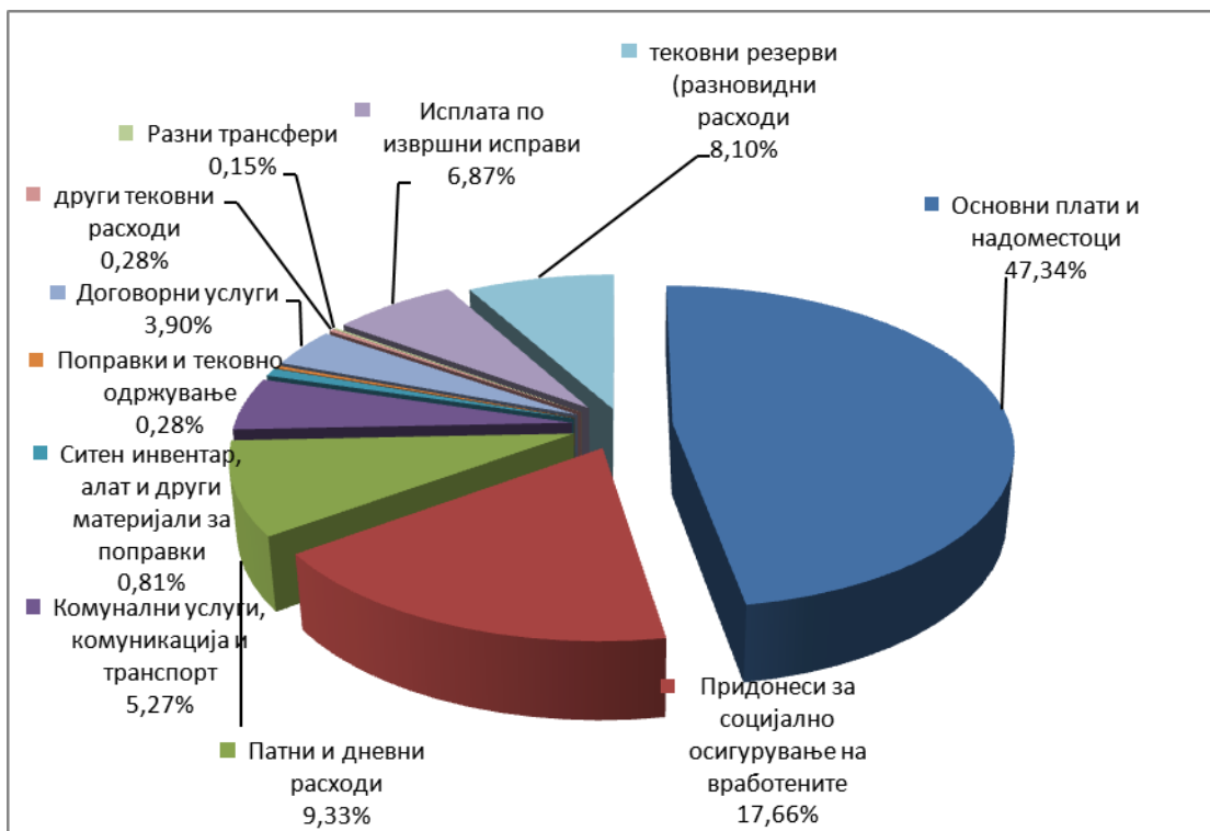
Процент на распоред на Буџетот на ДКСК по ставки

За остатокот на средствата во висина од 174.025,00 денари, а врз основа на потпишан договор за реализација на проекти со Амбасадата на Кралството на Норвешка во Република Македонија, ДКСК во јануари 2013 година од Министерство за финансии-Сектор за буџет и фондови побара проширување на буџетот на ДКСК на донаторската сметка за реализација на останатите активности од проектот „Антикорупциска едукација на учениците од основните училишта“.